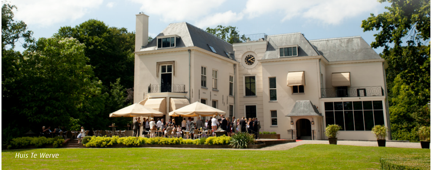
Huis Te Werve

In 1697 vormde Huis ter Nieuburgh het middelpunt van de onderhandelingen en ondertekening van de Vrede van Rijswijk. Dit paleis met aanpalende buitenverblijven maakte – voordat het eind 18de eeuw werd gesloopt – deel uit van een aaneengesloten gebied met buitenplaatsen. Deze route voert langs het nog aanwezige deel van dit prachtige buitengebied. Richting het centrum van Rijswijk zijn de nog bestaande buitenverblijven in de loop der tijd ingesloten geraakt door woningbouw. De route loopt hier dus door een meer verstedelijkt gebied. Gelukkig bleef de kern van sommige buitenplaatsen, bestaande uit een landhuis met de omliggende tuin ongemoeid. Het zijn nu openbare parken.