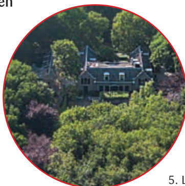
5. Landgoed Offem

Het kweken van kruiden vormde sinds de middeleeuwen een belangrijke bron van inkomsten in Noordwijk. Het dorp verwierf vooral met de teelt van medicinale kruiden landelijke en zelfs internationale bekendheid. De buitenplaats Calorama herinnert nog aan dit verleden. Het is van oorsprong een kruidenkwekerij die later werd omgevormd tot buitenplaats. Het is een van de buitens waarlangs de route leidt. Naast Calorama wandelt u langs de buitenplaatsen Offem, Dijkenburg, Klein Leeuwenhorst en Nieuw Leeuwenhorst. Een deel van het parkbos van Klein Leeuwenhorst en het park Nieuw Leeuwenhorst zijn voor het publiek toegankelijk.